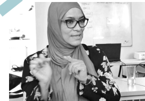
La maison de la famille