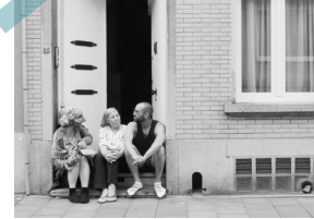
Rues Vonck & Verboekhaven