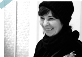
La Barricade asbl